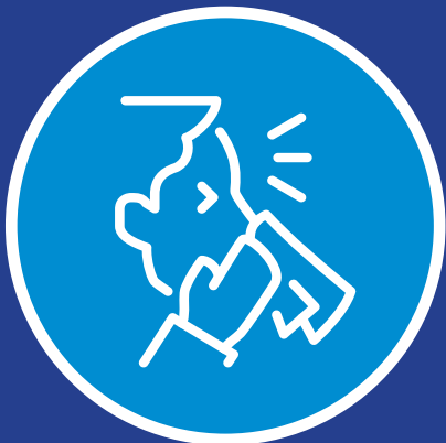
ریزش آب بینی