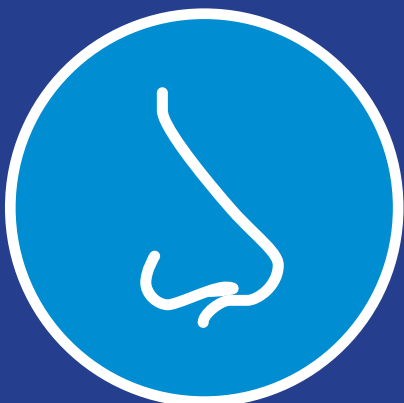
از دست دادن احساس بوی