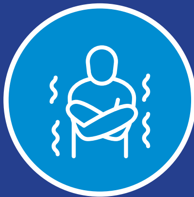
لرزه یا عرق